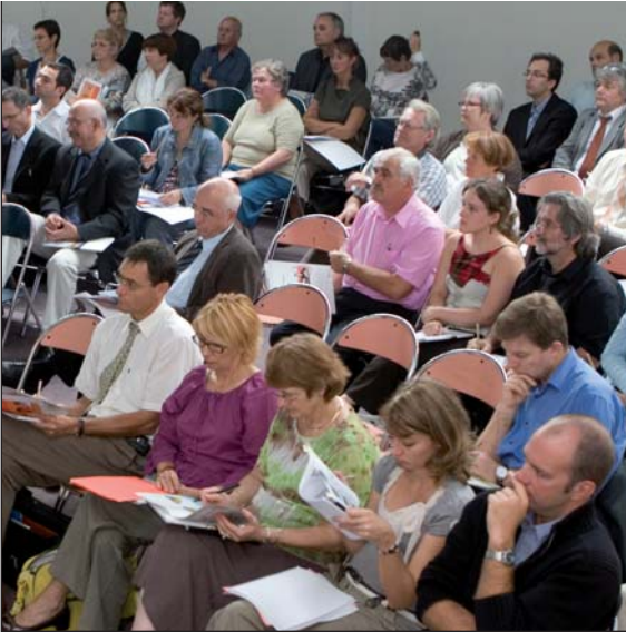
© David CESBRON - Region Franche-Comte