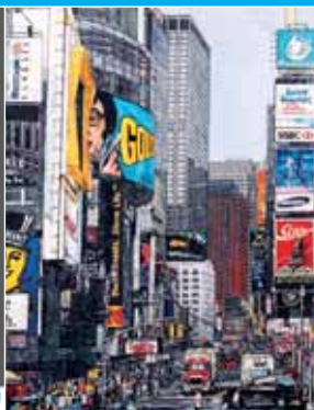
20 Maxime Lhermet.