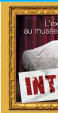
16 La Jurassienne de réparation.