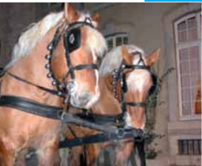
22 Comtois en folie.