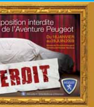
18 Exposition interdite.