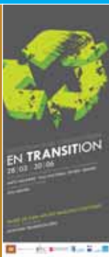
19 En transition.