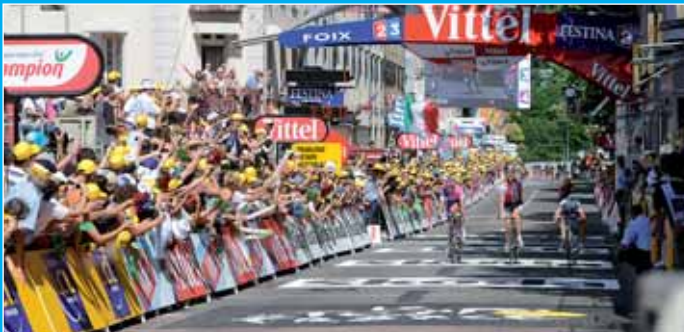
23 Tour de France.