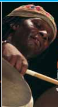
1 Zic en tête.