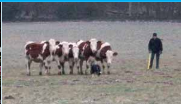
Finale nationale de chiens de troupeaux

Juillet-Août, Dole (39) Tél. : 03 84 69 01 54 www.doledujura.fr