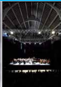
Les Jardins Musicaux