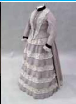
50 ans d'élégance en Haute-Saône