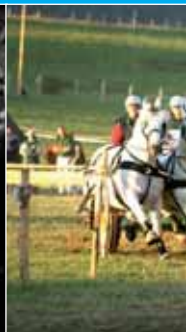
Franche Comté, Terre de Tra