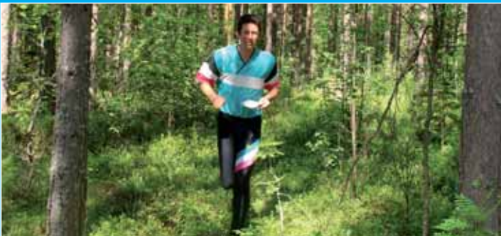
Les 3 Jours de Franche-CO'mté