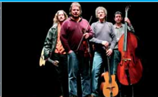
Festival jazz et musique improvisée