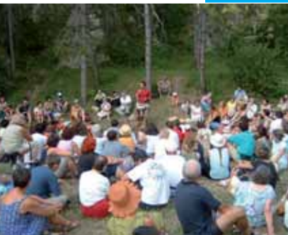
Festival de bouche à oreille