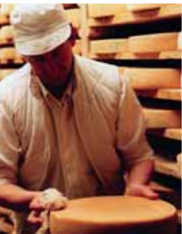
Fête du morbier