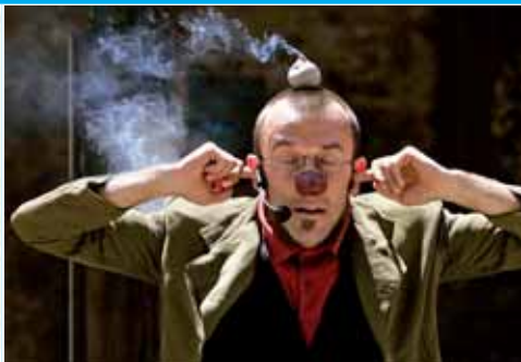
Festival de l'eau vive